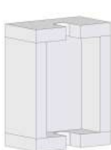
Brandschutzummantelung für UP-fix® UNO

Amtlicher Nachweis durch Brandschutzprüfung: 450.41 Prüfzeugnis EMPA Nr. 41409/2 allg. bauaufsichtliches Prüfzeugnis P-2101/039/16-MPA BS (IBMB)